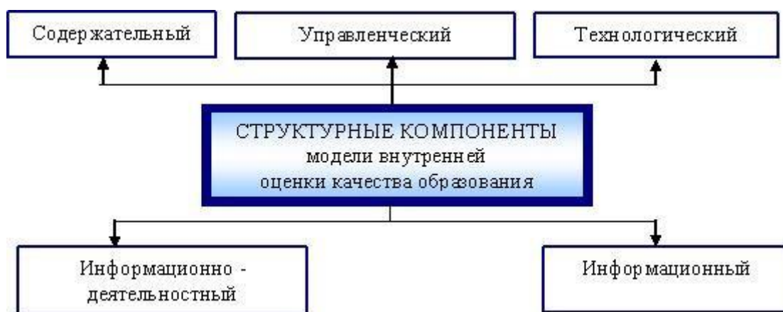
Рис. 1. Структурные компоненты модели внутренней оценки качества образования